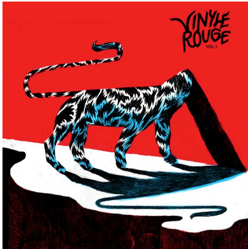
Cover de la compilation par Antoine Marchalot

Désormais cet objet qui traversera le temps sera le symbole de notre activisme.